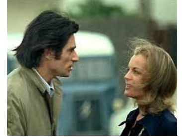
1972 CÉSAR ET ROSALIE de Claude Sautet avec Sami Frey