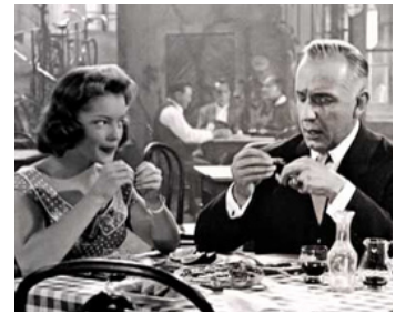
1956 KITTY (Kitty und die große Welt) d'Alfred Weidemann avec O. E. Hasse