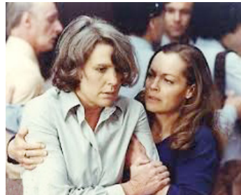
1978 UNE HISTOIRE SIMPLE de Claude Sautet avec Arlette Bonnard