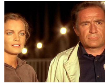
1970 LA CALIFFA (La Califfa) d'Alberto Bevilacqua avec Ugo Tognazzi