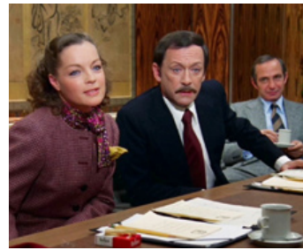
1970 LIÉS PAR LE SANG (Bloodline) de Terence Young avec Maurice Ronet, Ben Gazzara