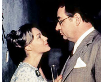
1975 LE VIEUX FUSIL de Robert Enrico avec Philippe Noiret