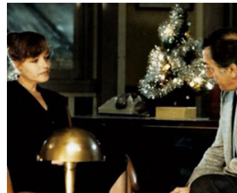
1981 GARDE À VUE de Claude Miller avec Lino Ventura