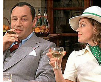
1976 UNE FEMME À SA FENÊTRE de Pierre Granier-Deferre avec Philippe Noiret