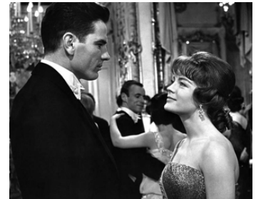
1963 LE CARDINAL (The Cardinal) d'Otto Preminger avec Tom Tryon