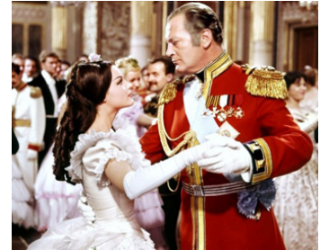
1959 KATIA (Katia) de Robert Siodmak avec Curt Jürgens