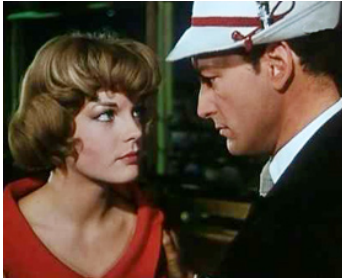
1959 EVA (Die Halbzarte) de Rolf Thiele avec Carlos Thompson