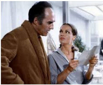
1970 LES CHOSES DE LA VIE de Claude Sautet avec Michel Piccoli