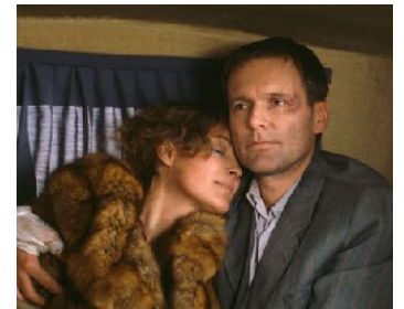
1982 LA PASSANTE DU SANS-SOUCI de Jacques Rouffio avec Mathieu Carrière