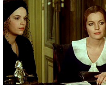
1973 LE TRIO INFERNAL de Francis Girod avec Michel Piccoli