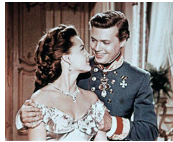
1955-1957 SISSI (Sissi, die junge Kaiserin) d'Ernst Marischka avec Karl-Heinz Boehm