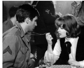
1962 LES VAINQUEURS (The Victors) de Carl Foreman avec Anthony Perkins