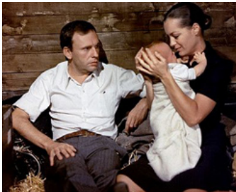
1973 LE TRAIN de Pierre Granier-Deferre avec Jean-Louis Trintignant