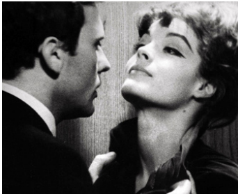
1961 LE COMBAT DANS L'ÎLE d'Alain Cavalier avec Jean-Louis Trintignant