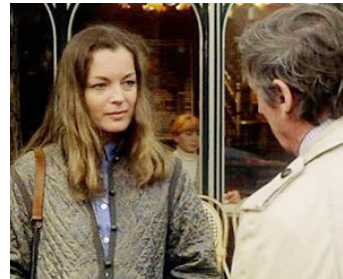
1979 CLAIR DE FEMME de Costa-Gavras avec Yves Montand