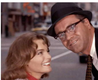
1964 PRÊTE-MOI TON MARI (Good Neighbor Sam) de David Swift avec Jack Lemmon