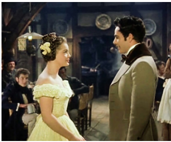
1954 LES JEUNES ANNÉES D'UNE REINE (Mädchenjahre einer Königin) d'E. Marischka