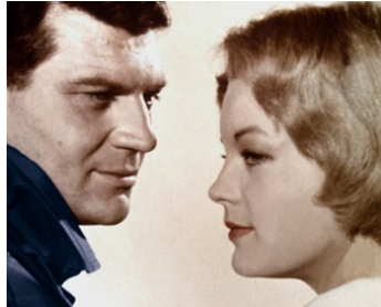
1959 MADEMOISELLE ANGE de Geza von Radvanyi avec Henri Vidal