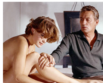
1966 DIX HEURES ET DEMIE DU SOIR EN ÉTÉ (10:30 PM Summer) de J. Dassin avec P. Finch