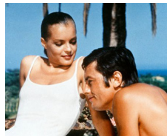
1968 LA PISCINE de Jacques Deray avec Alain Delon