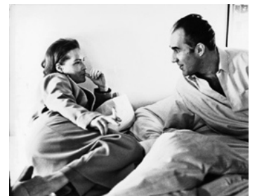
1966 LA VOLEUSE de Jean Chapot avec Michel Piccoli