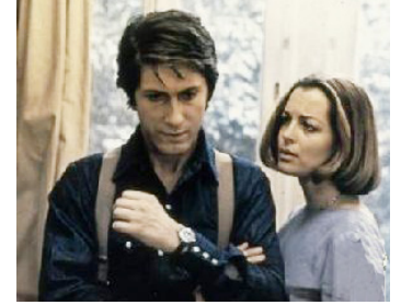
1974 L'IMPORTANT C'EST D'AIMER d'Andrzej Zulawski avec Jacques Dutronc