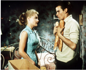
1957 MONPTI (Monpti) d'Helmut Käutner avec Horst Buchholz