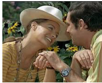
1970 QUI ? de Léonard Keigel avec Maurice Ronet