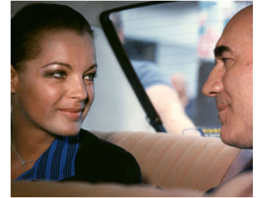
1976 MADO de Claude Sautet avec Michel Piccoli