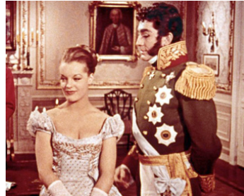
1959 LA BELLE ET L'EMPEREUR (Die schöne Lügnerin) d'Axel von Ambesser avec J.-C. Pascal