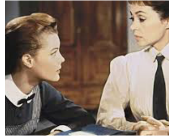
1958 JEUNES FILLES EN UNIFORME (Mädchen in Uniform) de G. von Radvanyi avec Lilli Palmer