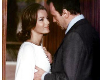
1973 LE MOUTON ENRAGÉ de Michel Deville avec Jean-Louis Trintignant