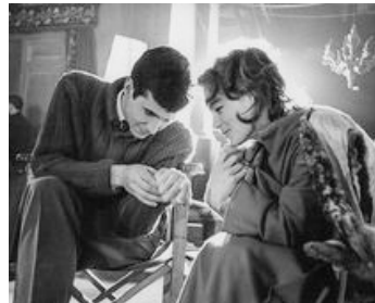
1962 LE PROCÈS d'Orson Welles avec Anthony Perkins