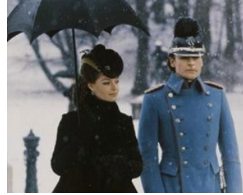
1972 LUDWIG, LE CRÉPUSCULE DES DIEUX de Luchino Visconti avec Helmut Berger