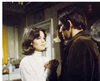
1968 OTLEÝ (Otleý) de Dick Clement avec Tom Courtenay