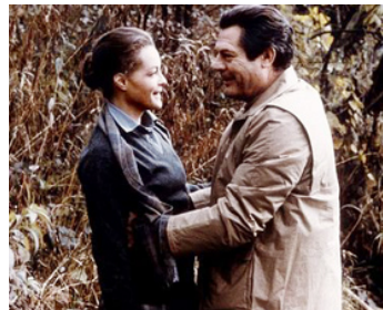
1981 FANTÔME D'AMOUR (Fantasma d'Amore) de Dino Risi avec Marcello Mastroianni