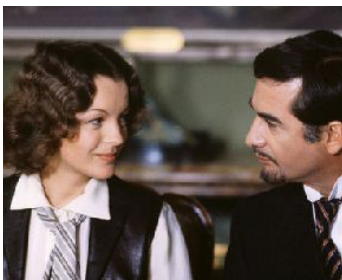
1980 LA BANQUIÈRE de Francis Girod avec Jean-Claude Brialy