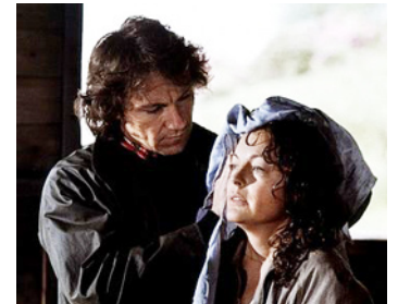
1979 LA MORT EN DIRECT (Death Watch) de Bertrand Tavernier avec Harvey Keitel