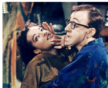
1965 QUOI DE NEUF, PUSSYCAT ? (What's new Pussycat ?) de Clive Donner avec Woody Allen